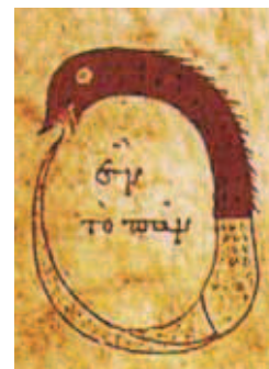
Ouroboros: Ein symbolisches Bild ca. aus dem 10. Jahrhundert zum Kreislauf des Vielen im Einen (griechische Inschrift «en to pan»).

Als der berühmte Biologe Louis Pasteur (1822–1895) die Bakterien erforschte und das Pasteurisieren erfand, hatte er einen «feindlichen Bruder»: Antoine Béchamp (1816–1908). Die beiden bekämpften sich lebenslanglich, besonders nachdem Béchamp Pasteur vorwarf, er habe ihm seine mikrobiologische Erklärung der Seidenraupenkrankheit geklaut und manches mehr. Der tiefere Zwist war aber ein anderer: Béchamp sah nicht, wie Pasteur, Zellen und Einzeller als kleinste Einheiten des Lebens an, sondern sogenannte «Mikrozyme» 3 : kleine Körnchen des Lebens, die im Kreislauf aus zerfallenden Zellen entstünden und dann, durch einige Wandlungsprozesse hindurch, wieder neue Gewebe und lebende Zellen aus sich zusammensetzten. Béchamps vorstellungsleitender Glaubenssatz war dabei: «Nichts fällt dem Tode anheim, alles dem Leben.» 4